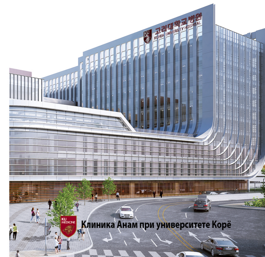
Клиника Анам при университете Корё

KOREA UNIVERSITY HOSPITAL HEALTH PROMOTION CENTER