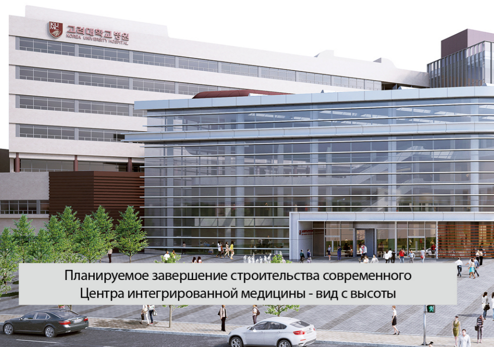
Планируемое завершение строительства современного Центра интегрированной медицины - вид с высоты

02841 г.Сеул, Сонбук-гу, Дорога Корё, 73(Анамдонг5га) Тел +82-2-920-6960 Факс +82-2-920-5108