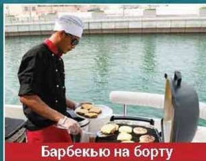
Барбекю на борту